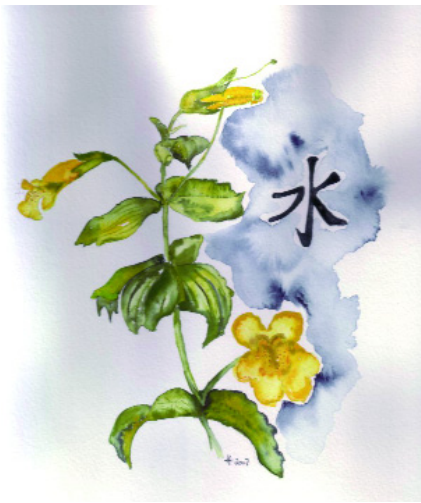
Mimulus (gefleckte Gauklerblume)