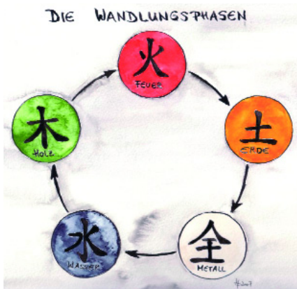
Zyklus der Fünf Wandlungsphasen

Es hat sich gezeigt, dass jeder Wandlungsphase zwei oder drei passende Bachblüten zugeordnet werden kann und damit die Regulation der energetischen Imbalancen einleiten und den blockierten Zustand der Lebenskraft des Menschen lösen. Für den Menschen wird somit der Prozess der Veränderung auf körperlicher und seelischer Ebene stärker wahrnehmbar und bietet für ihn die Möglichkeit aktiv damit zu arbeiten.